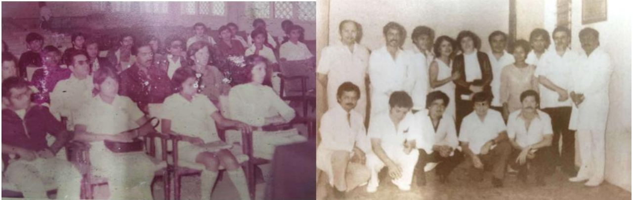
Imagen 5. Del lado derecho se aprecia a la primera generación de Técnicos Histopatólogos y Embalsamadores; en el lado izquierdo se aprecia a la primera generación de la Maestría en Medicina Forense.

En el ámbito educativo, se desarrollaron dos programas educativos (imagen 5); la carrera de técnico histopatólogo y embalsamador el día 13 de enero de 1975, con una duración de un año, y dos años después el primer posgrado de medicina forense en México y toda Latinoamérica, con una duración de 4 semestres (Rodríguez, 2017); en la investigación se establecieron cuatro áreas disciplinarias: Medicina Forense, Toxicología, Derecho penal, Criminología y Criminalística (García Salazar et al., 2021).