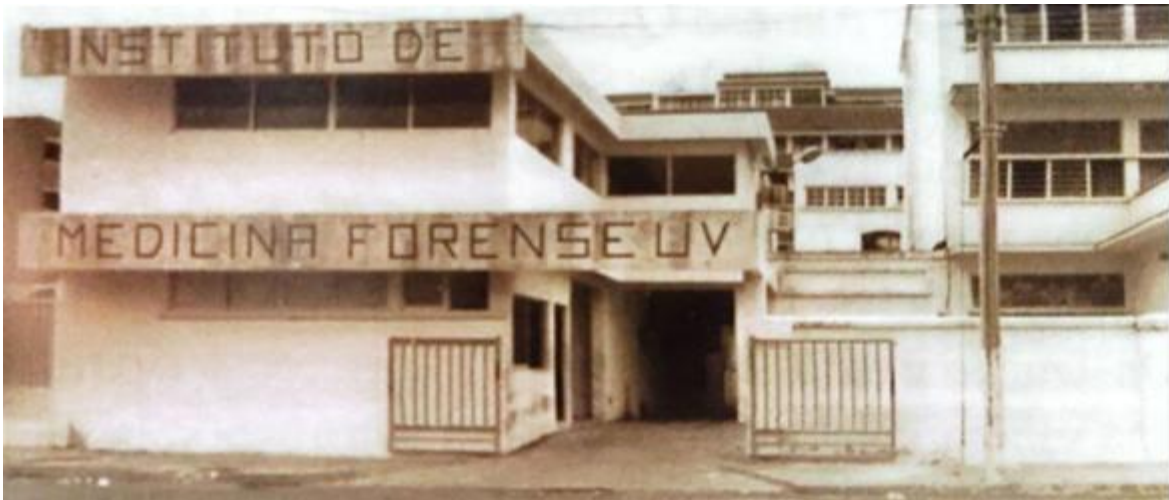
Imagen 3. Fachada del Instituto de Medicina Forense, antigua ubicación.

Otro paso más en beneficio de la justicia del estado de Veracruz y ejemplo para todo México fue haber visto nacer el primer Instituto de Medicina Forense de la Universidad Veracruzana a las 11 horas del 16 de junio de 1974 en el Puerto de Veracruz, ubicándose en la calle Carmen Serdán esq. Mina (imagen 3).