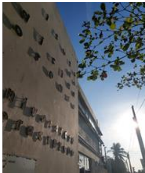
Imagen 7. Fachada de la actual ubicación del Instituto de Medicina Forense.