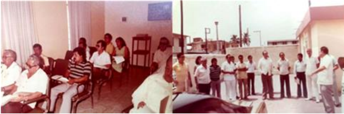
Imagen 6. Del lado izquierdo se aprecian a alumnos de la Maestría en Medicina Forense tomando clases en el aula de enseñanza; del lado derecho se aprecia el patio de maniobras del INMEFO UV.