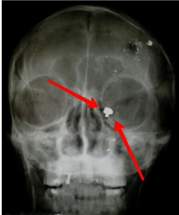
Fig. 1, Radiografía de cráneo, presenta cuerpo extraño de densidad metálica (PAF) en pared interna de orbita izquierda, piso anterior, nótese la presencia de esquirlas de densidad metálica en calota y maxilar superior izquierdo.

La limpieza de los huesos es recomendable que se realice mediante cepillado; si se trata de polvo o restos de tierra fina y si las adherencias precisan ser removidas con líquido, se sugiere se efectúe con agua de grifo y libre de soluciones.