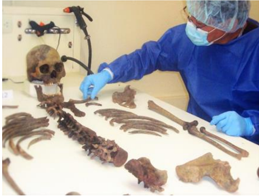
Fig. 2. Reconstrucción esquelética, en laboratorio de antropología Física Forense