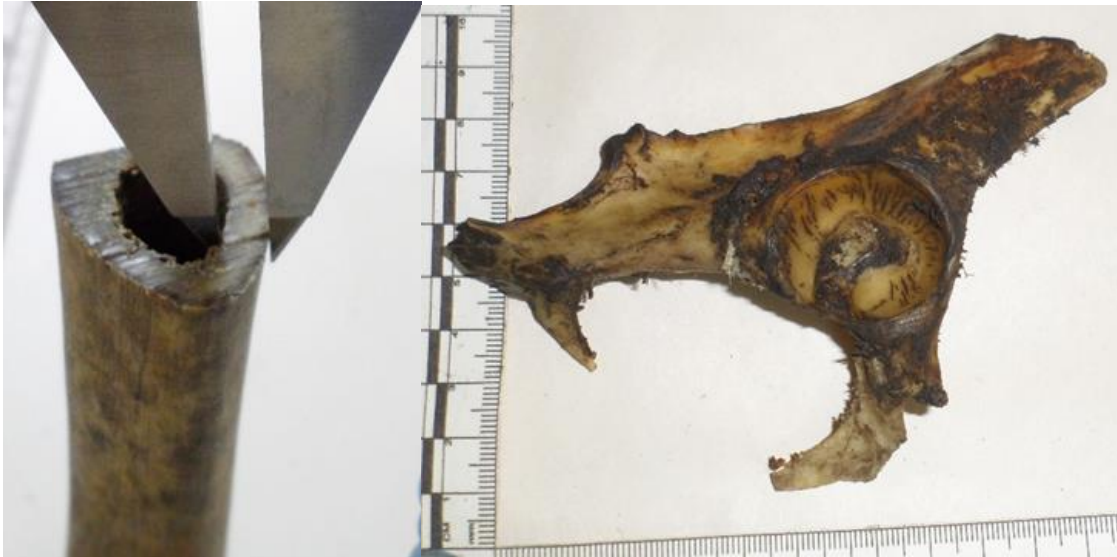
Fig. 4. Del lado izquierdo, apreciamos la medición del diámetro del canal medular; del lado derecho, agujero obturador amplio, predominancia transversal, acetábulo pequeño.