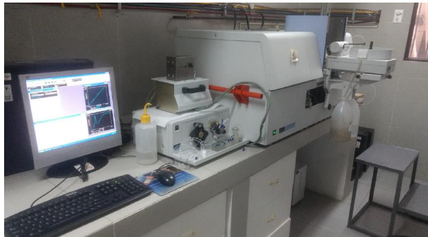
Figura 2. Espectrofotómetro de absorción atómica Perkin-Elmer modelo Analyst 800

rotulada con los datos necesarios. Las muestras fueron digeridas en medio ácido y analizadas en un atomizador electro térmico de la marca Perkin Elmer, modelo Analyst 800 (figura 2).